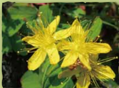
Kurodake no ohanatachi くろだけのおはなたち