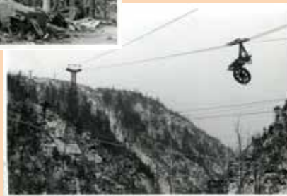
ゴンドラが付く前↑