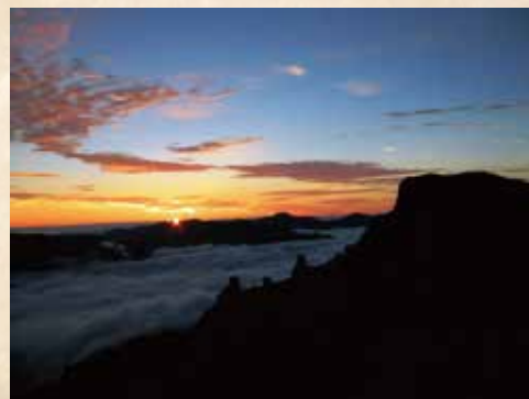
山頂から (桂月岳) ↑